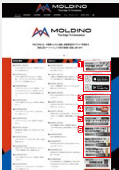
ウェブサイト トップページ Websight top page